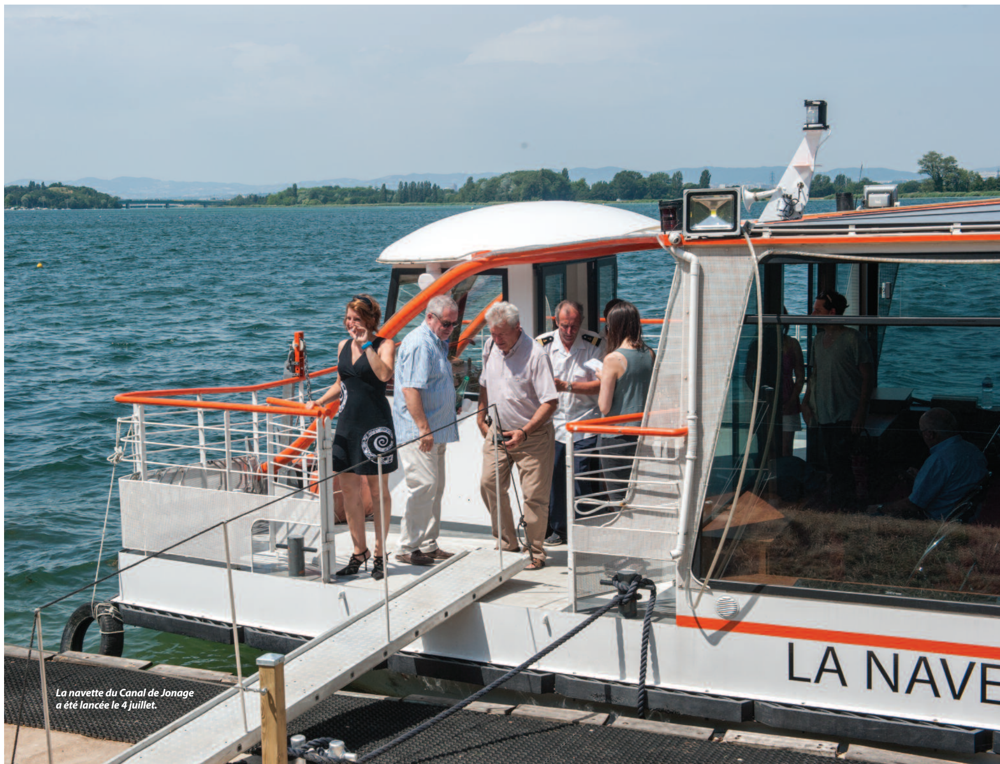
La navette du Canal de Jonage a été lancée le 4 juillet.