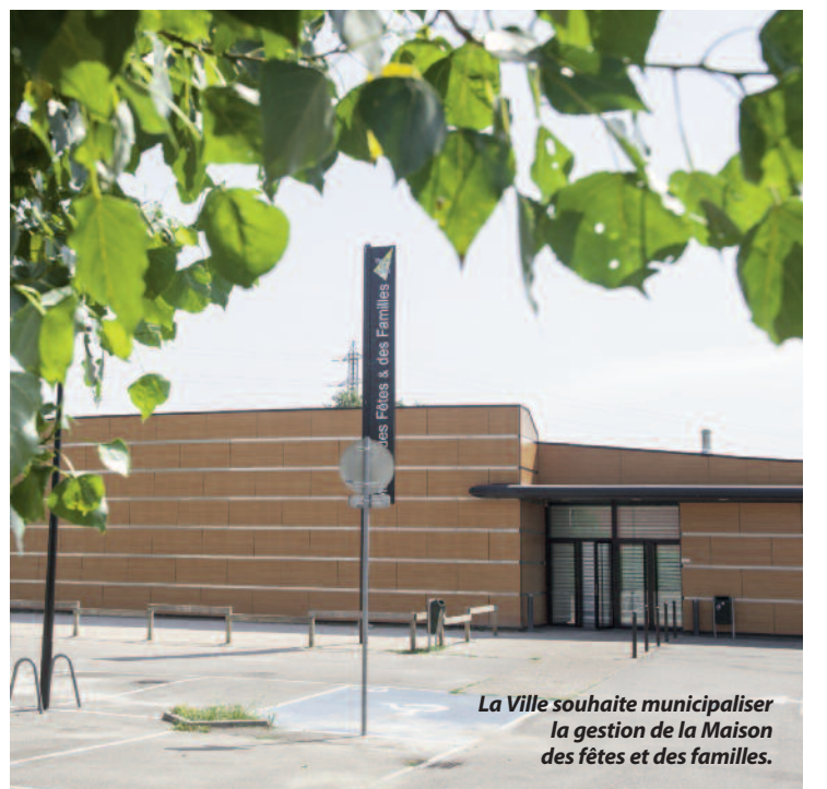
La Ville souhaite municipaliser la gestion de la Maison des fêtes et des familles.