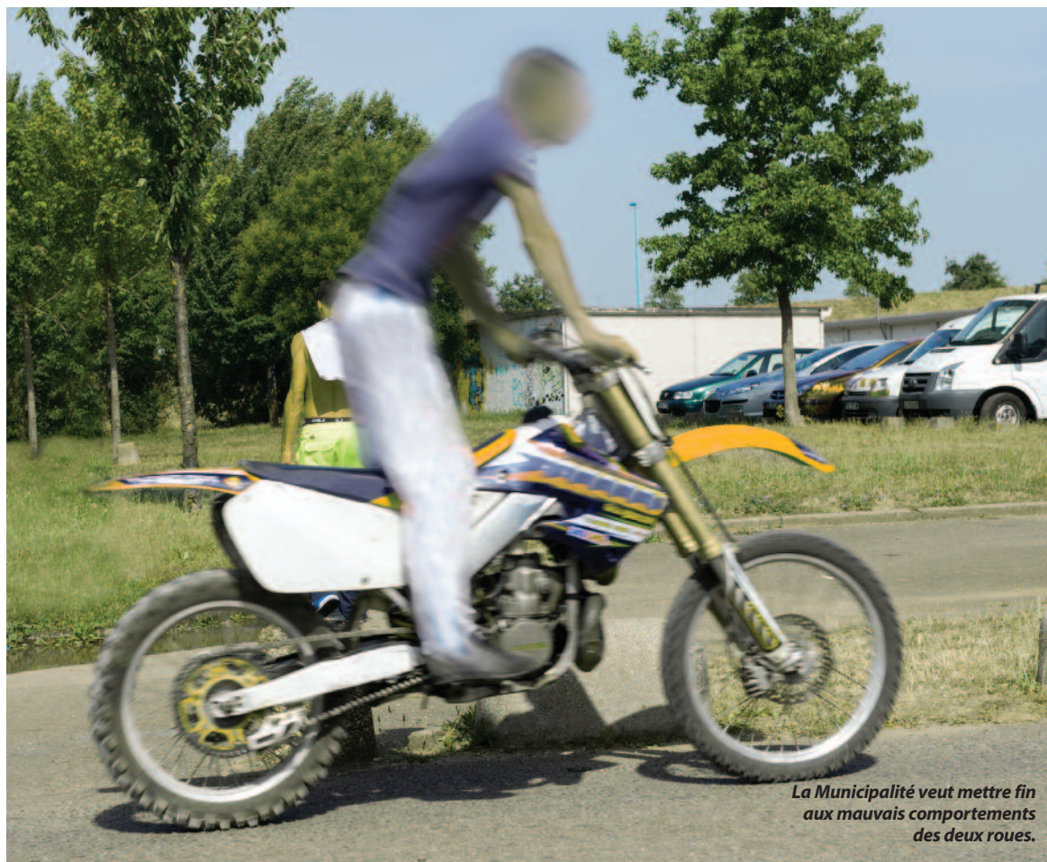
La Municipalité veut mettre fin aux mauvais comportements des deux roues.

Outre la réactivation du Conseil local de sécurité et de prévention de la délinquance (CLSPD) réuni en juillet 2014, et la création de deux nouvelles commissions ("prévention et tranquillité publique" associant notamment les quatre adjoints de quartier, et "traitement opérationnel et de suivi" animée avec l'Etat) ; outre le Plan local d'actions de prévention de la délinquance signé entre la Ville, l'Etat, la Métropole, l'Education nationale, le Parquet et le Tribunal de grande instance, la Ville de Vaulx-en-Velin prévoit de renforcer les effectifs de Police municipale, avec toujours l'objectif de porter l'effectif à 20 personnes à la fin du mandat. Par ailleurs le système de vidéo protection des espaces publics (38 caméras aujourd'hui) va être totalement refondu, le fonctionnement du Centre superviseur urbain modifié et enrichi de trois nouveaux agents (portant l'effectif à dix). A noter encore la création d'un poste de police au rez-de-chaussée de l'immeuble le Copernic. Enfin, les agents de média-