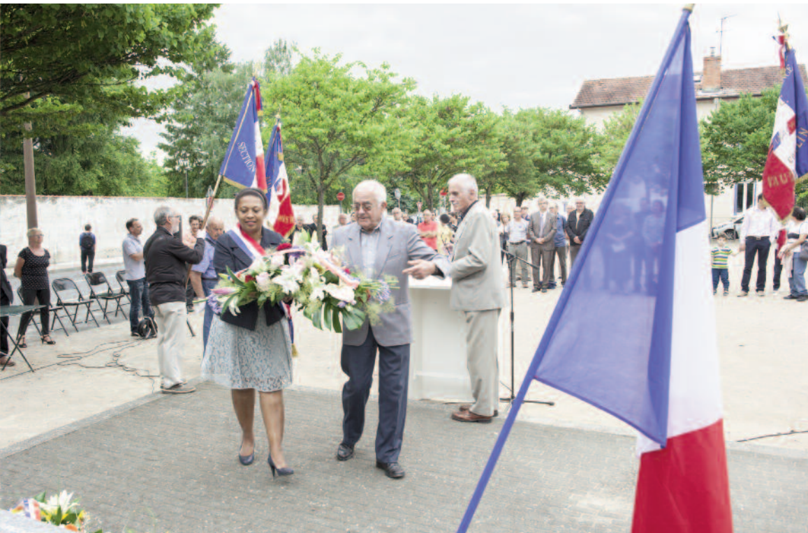
La Ville célèbre le 75e anniversaire de l'appel du général de Gaulle Devant le monument aux morts, square Gilbert-Dru, anciens combattants, élus et citoyens se sont retrouvés pour se souvenir de l'appel du 18 juin 1940 du général de Gaulle à la BBC. Dans son allocution, Hélène Geoffroy a rendu hommage "aux quatre résistants vaudais et aux étrangers qui ont participé à la libération de la Nation". Et la députée-maire d'ajouter : "Le 18 juin reste la date emblématique de ceux qui se sont engagés".