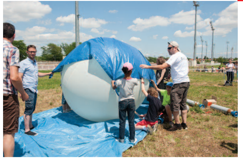
A l'assaut du ciel avec Festiciels Samedi 20 juin, l'hippodrome de Vaulx-en-Velin basé au Carré de Soie s'est transformé en un immense champ d'expérimentations scientifiques dans le cadre de la manifestation Festiciels organisée par l'association Planète sciences, en partenariat avec la ville. Fabrication de fusées à eau, de cerfs volants, lâchers de ballons stratosphériques, l'observation du Soleil avec la complicité du Club astronomie Lyon Ampère (Cala) ; toutes ces activités scientifiques abordées de manière ludique, depuis 14 ans, font la joie des enfants.