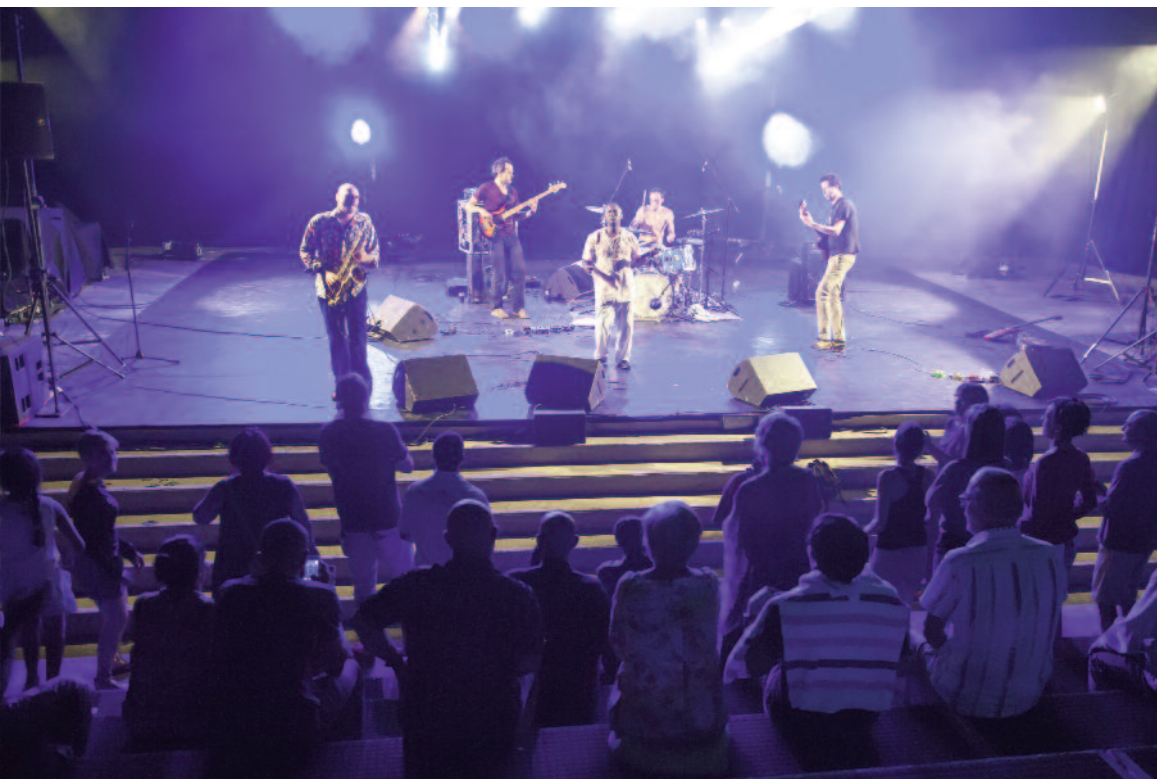
Le plein d'émotions pour Festiv'aux Amphis Rire, danser, s'émuvoir... Festiv'aux Amphis c'est un peu tout ça. Entre le jeudi 25 et samedi 27 juin, près de 500 personnes ont assisté aux représentations du Lucathéâtre, de la compagnie de danse Atou et à la soirée musicale en compagnie du saxophoniste Lionel Martin et de son acolyte Asnaké Guebryes. L'occasion de dynamiser le théâtre de verdure, mitoyen au cinéma les Amphis, un lieu peu connu des Vaudais.