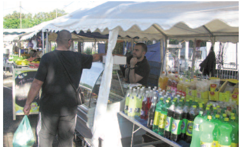
Cap au sud pour le marché du Ramadan C'est une première, pour cette année 2015 le marché du Ramadan s'installe au Sud, place Cavellini. Organisé depuis 2010 par le Centre musulman de Vaulx-en-Velin Okba (CMVO), ce marché était situé jusqu'à lors sur le site de la future mosquée. Pains, pâtisseries, fruits et légumes, le marché propose de quoi rompre le jeûne ou ravir les gourmands. Il se tient chaque jour de 17h à 21h, jusqu'au 17 juillet.