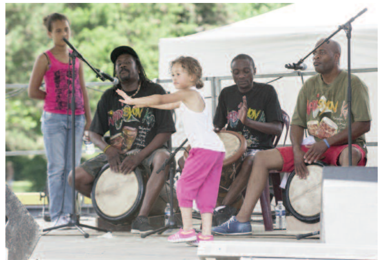
Bonne ambiance pour le festival Couleur(s) Mundo Si la journée du 4 juillet a été particulièrement chaude au Grand-Parc, ce n'est pas le seul fait du mercure. L'ambiance festive de Couleur(s) Mundo y est pour quelque chose. Le public a pu découvrir, ou redécouvrir, sur les différentes scènes, des artistes bien connus dans la commune : les danses du Café Folk & Country, des compagnies Ot Izvora et Atou et le rock méditerranéen des Villeurbannais de Zen Zila.